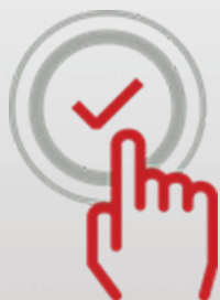
Une touche suffit

Une qualité et une fiabilité réputées, basées sur 50 ans d'expérience et une technologie à la pointe du marché, font de Fujitsu la référence des scanners dans le monde entier.